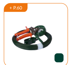
Accessoires de pose