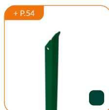
Jambe de force L