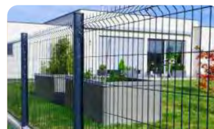
P.58 - Panneau Athletico 244