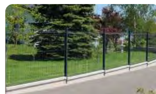
P.64 - Panneau Geno