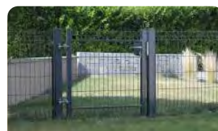
P.134 - Portail & portillon Argo