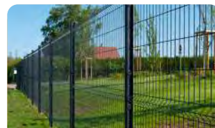
P.66 - Panneau Argo