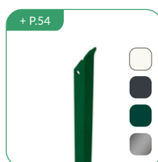
Jambe de force L