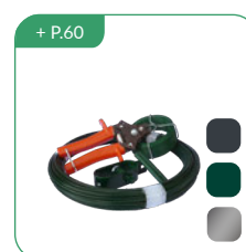
Accessoires de pose