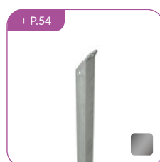
Jambe de force L