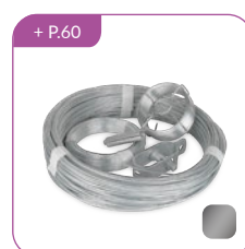
Accessoires de pose