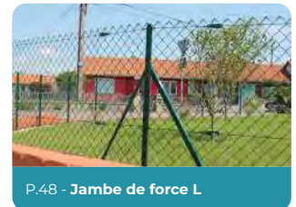
P.48 - Jambe de force L