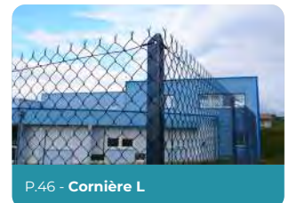
P.46 - Cornière L