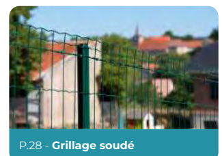
P.28 - Grillage soudé