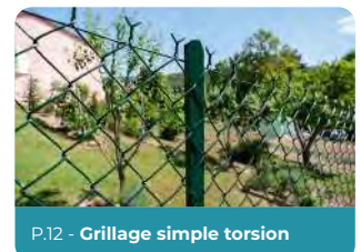
P.12 - Grillage simple torsion