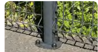
Platine à manchonner Orion