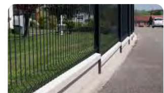
P.84 - Dalle béton