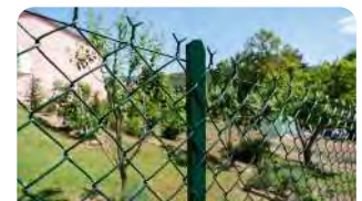
P.12 - Grillage simple torsion