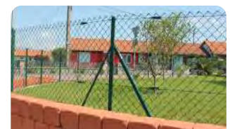
P.48 - Jambe de force L