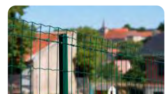
P.28 - Grillage soudé