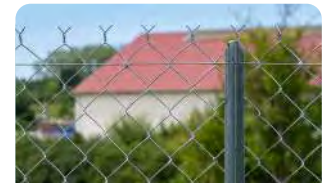
P.44 - Poteau Té