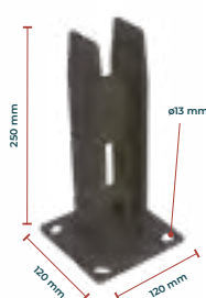
Platine standard pour muret 25 cm ou plus

Les platines à manchonner Argo Connect s'associent aux poteaux Argo Connect pour réaliser une pose sans avoir à creuser de scellement ni à couler de béton. Elles sont généralement utilisées pour la pose d'une clôture sur un muret ou sur une dalle bétonnée par exemple.