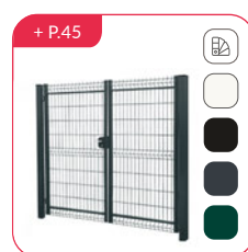
Portail & Portillon résidentiels