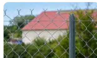
P.44 - Poteau Té