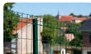
P.28 - Grillage soudé