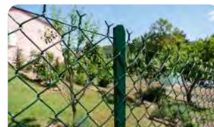
P.12 - Grillage simple torsion