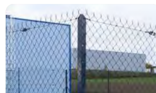
P.46 - Cornière L