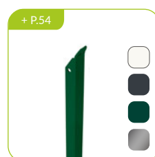
Jambe de force L