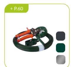
Accessoires de pose